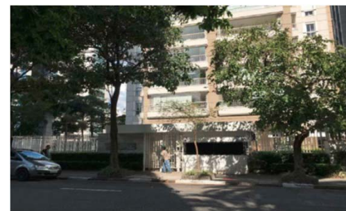
Alameda dos Arapanés, 631 – Indianópolis